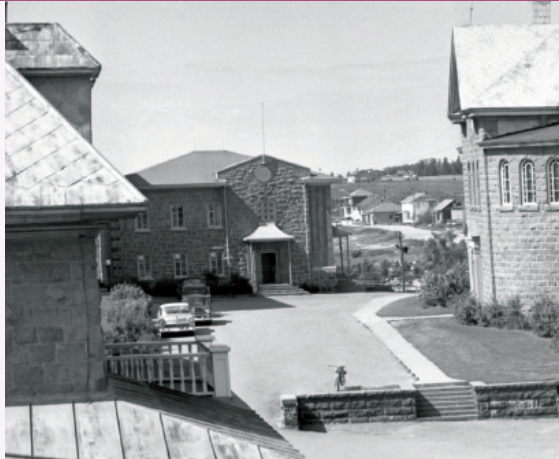
Édifice Paul-Tremblay, en retrait de la voie publique, 1956.

En 1948, au 50 rue Saint-Joseph, débute la construction de la Maison Saint-Jean-Baptiste, mieux connue à l'époque sous le nom d' unité sanitaire . L'édifice abrite alors les organismes catholiques de la paroisse : la Société Saint-Jean-Baptiste, la Jeunesse ouvrière catholique et la Société Saint-Vincent-de-Paul. Le rez-de-chaussée est également loué au ministère de la Santé pour loger son unité sanitaire, ce qui lui vaut son appellation la plus fréquente.